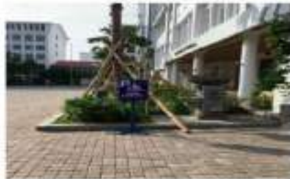
Area Parkir Khusus Difabel