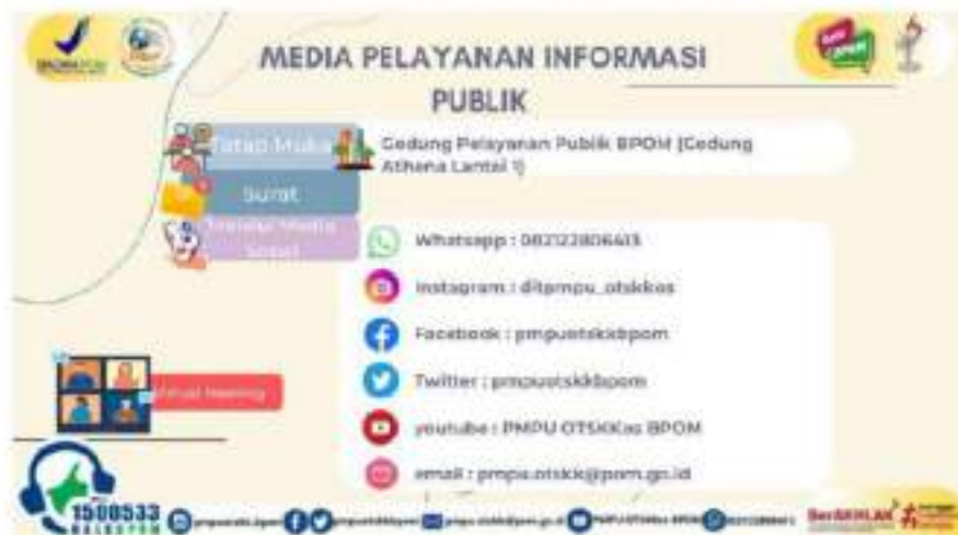
Gambar 2.1 Media Pelayanan Informasi Publik PPID Pelaksana Dit PMPUOTSKK

Ketersediaan sarana komunikasi merupakan salah satu faktor yang memudahkan masyarakat dalam mengakses informasi publik di Direktorat Pemberdayaan Masyarakat Dan Pelaku Usaha Obat Tradisional, Suplemen Kesehatan dan Kosmetik. Berbagai inovasi media layanan dan sosialisasi informasi publik terus dikembangkan mengikuti perkembangan teknologi dan gaya hidup masyarakat untuk memudahkan masyarakat dalam mengakses layanan PPID Pelaksana Dit PMPUOTSKK. Media layanan PPID Dit PMPUOTSKK baik secara elektronik maupun non elektronik yaitu: