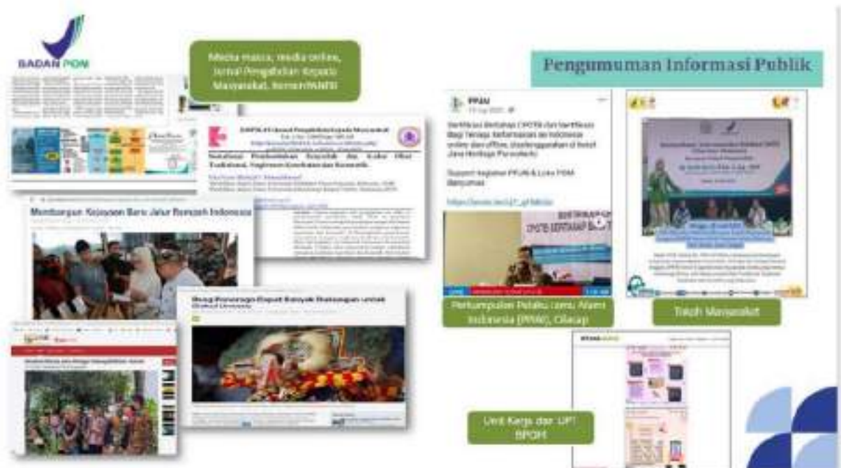
Gambar 4.4. Dokumentasi Kolaborasi Pengumuman Informasi Publik