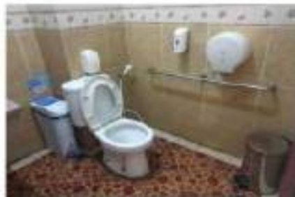
Toilet Khusus Difabel