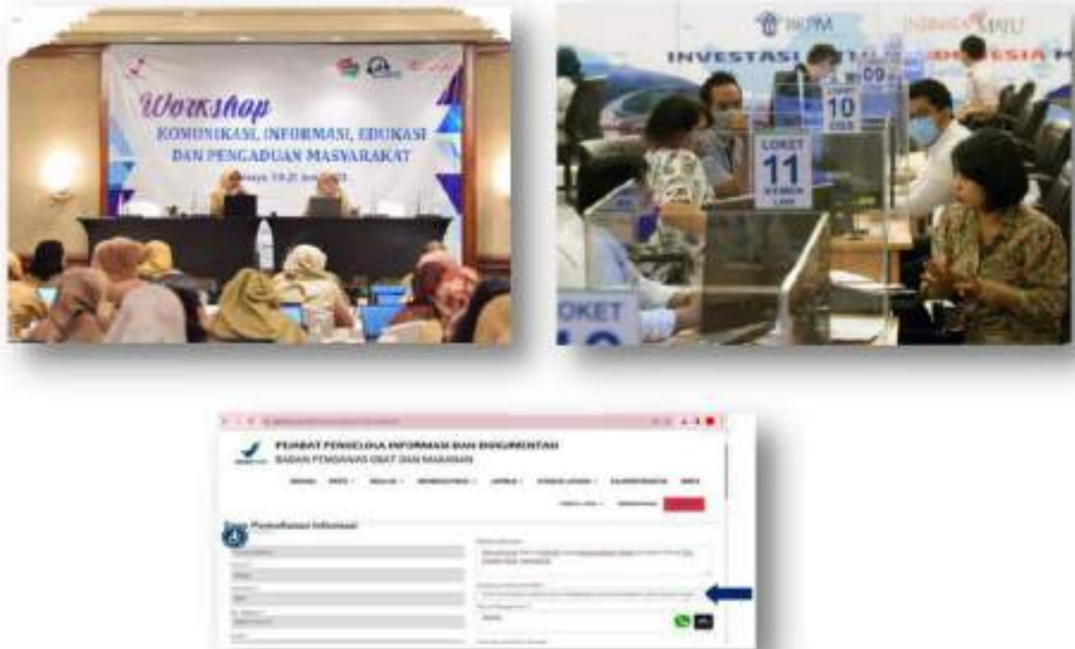
Gambar 4.5 Dokumentasi Kolaborasi Pelayanan Informasi Publik