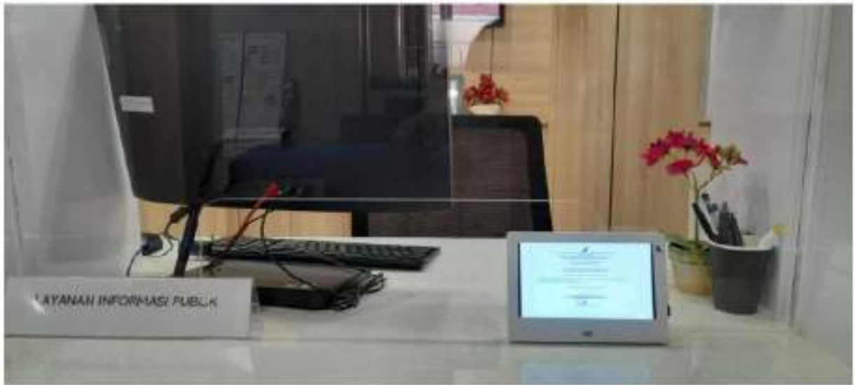
Gambar 2.3 Ruang Layanan Informasi Publik PPID Pelaksana Dit PMPUOTSKK