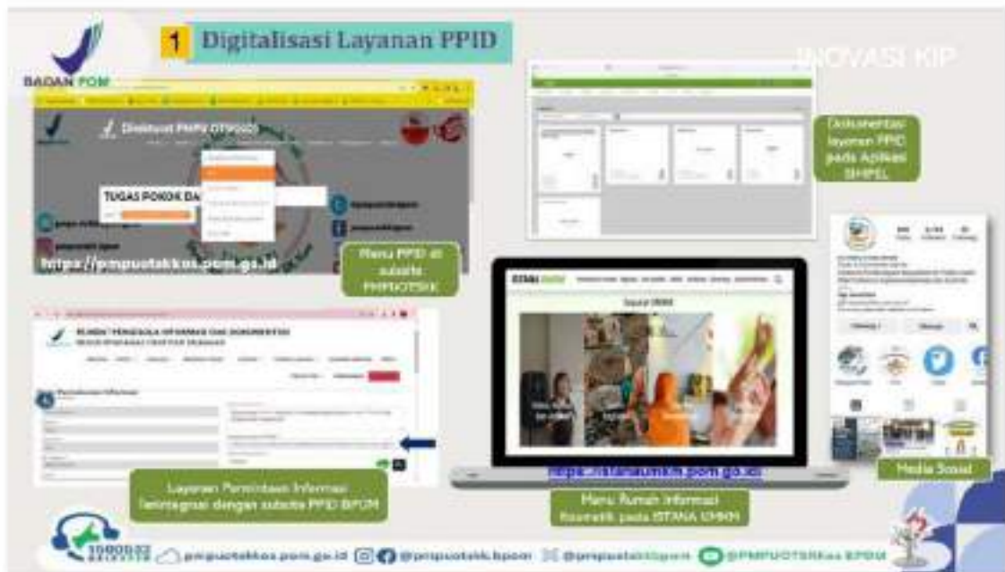
Gambar 4.1 Dokumentasi Digitalisasi Layanan PPID Pelaksana Dit PMPUOTSKK