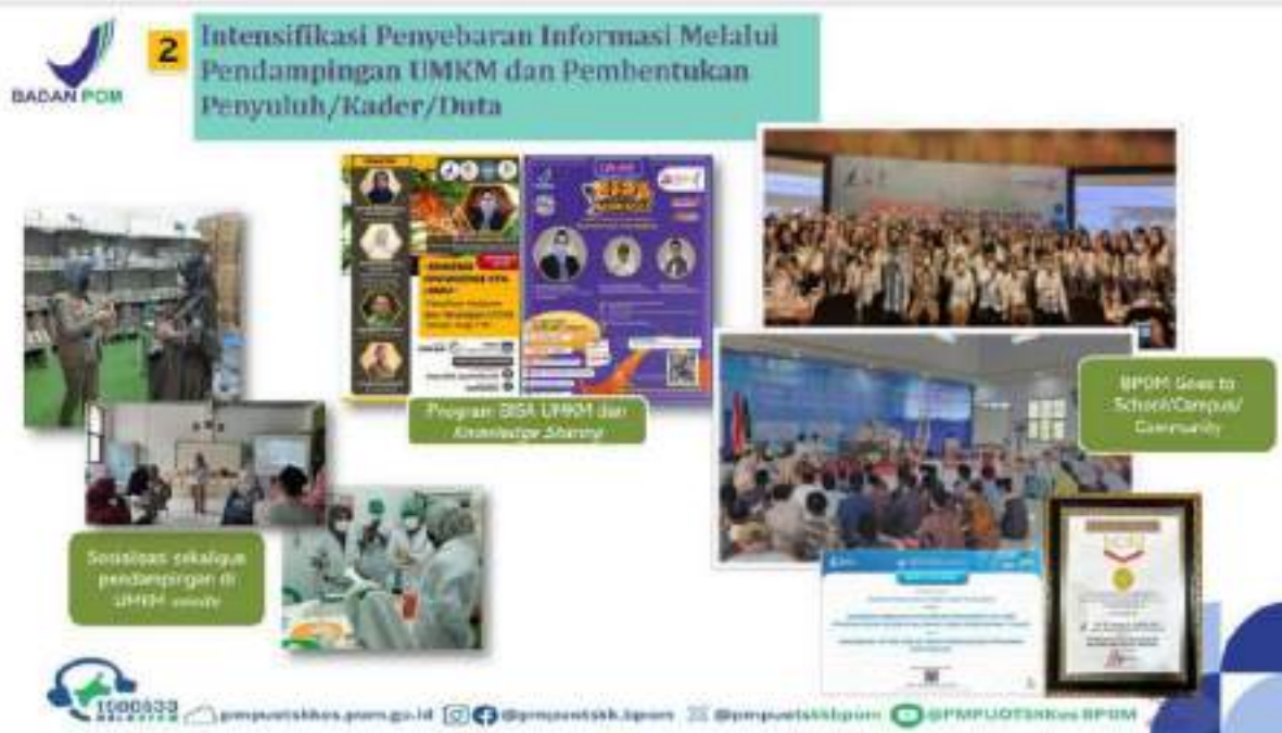
Gambar 4.2 Dokumentasi Intensifikasi Penyebaran Informasi Melalui Pendampingan UMKM dan Pembentukan Penyuluh/Kader/Duta