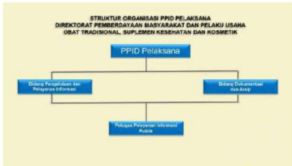
Gambar 1.1 Struktur Organisasi PPID Pelaksana Dit PMPUOTSKK