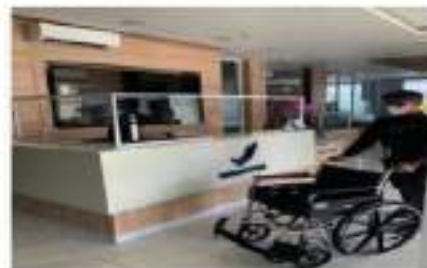
Kursi Roda dan Petugas Khusus yang Membantu