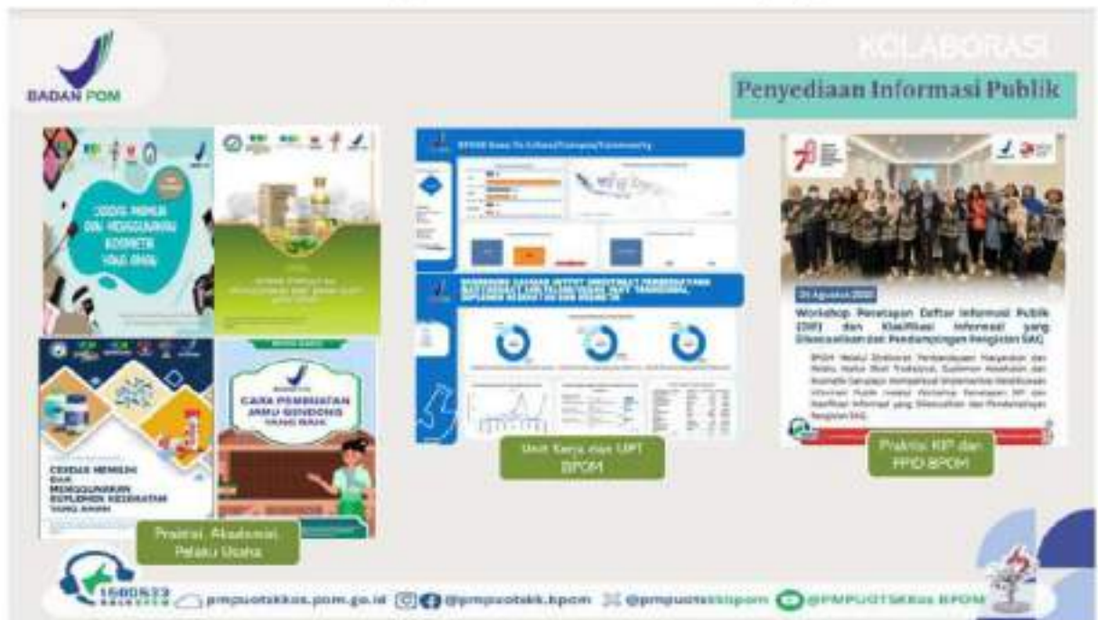
Gambar 4.3 Dokumentasi Kolaborasi Penyediaan Informasi Publik