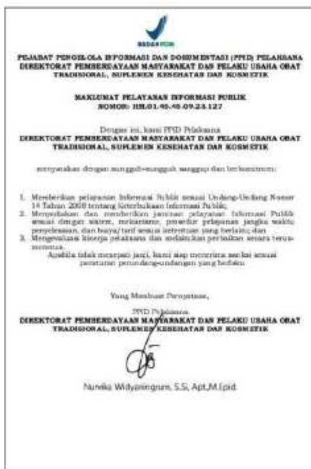
Gambar 1.2 Maklumat Pelayanan Informasi Publik

Apabila tidak menepati janji, kami siap menerima sanksi sesuai peraturan perundang-undangan yang berlaku.