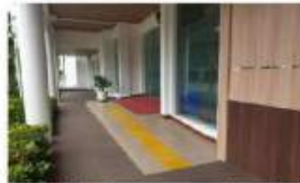
Step lobby bagi pengguna kursi roda