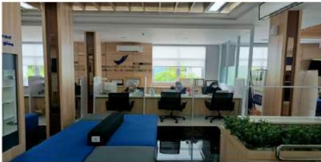
Gambar 2.2 Ruang Tunggu Layanan PPID Pelaksana Dit PMPUOTSKK